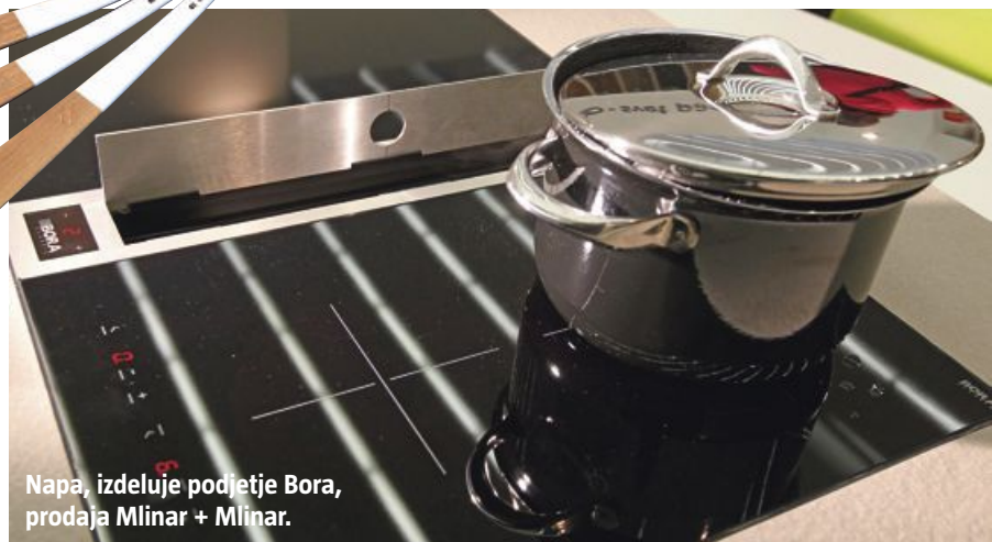
Napa, izdeluje podjetje Bora, prodaja Mlinar + Mlinar.