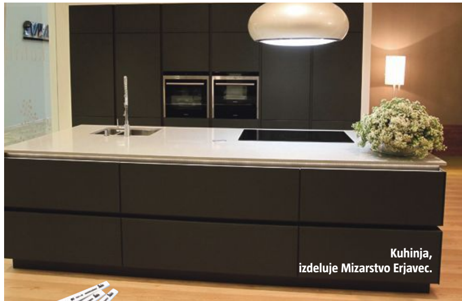
Kuhinja, izdeluje Mizarstvo Erjavec.

Lahkotnost v oblikovanju, tanke linije, naravna barva, naravni material – les so besede, s katerimi sta pojasnili, zakaj so ju prepričali stol in mizica Vogel ter modularni sistem Mix box blagovne znamke Collignum, ki so ju oblikovali v biroju Trije arhitekti. Kakor pravita, bi se podali v kakšno lepo oblikovano kočico, vendar bi jih lahko vključili tudi v minimalistični interior. Stol sta preskusili in ugotovili, da je veliko bolj udoben, kot se zdi na prvi pogled. »Omarica iz kock je zanimiva, ker se lahko razstavlja in na novo oblikuje. Preprosto odvijesh lesene vijake, kocke