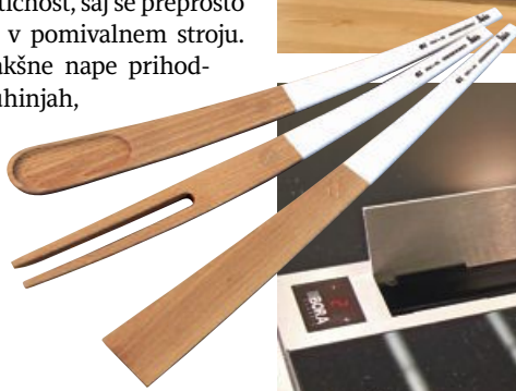
Leseni pribor, oblikovanje Gigodesign, bla- govna znamka Leis, izdeluje Rimarket.