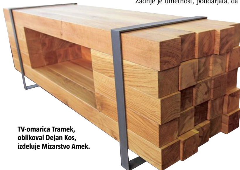
TV-omarica Tramek, oblikoval Dejan Kos, izdeluje Mizarstvo Amek.