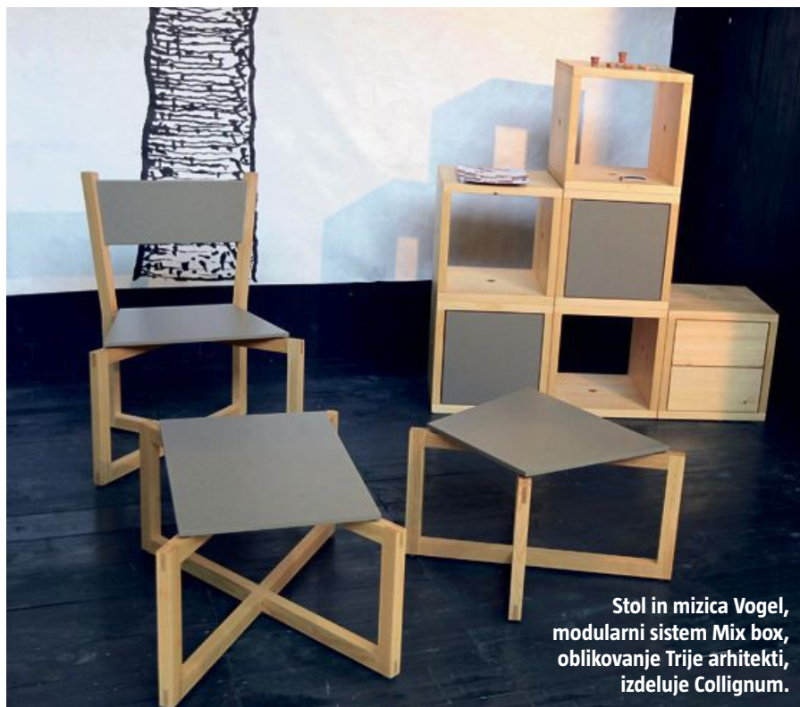
Stol in mizica Vogel, modularni sistem Mix box, oblikovanje Trije arhitekti, izdeluje Collignum.